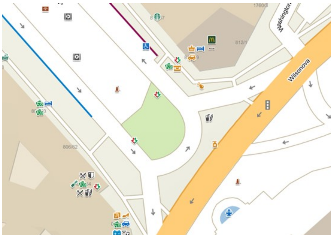
Mapy.cz a zobrazená horní část Václavského náměstí kolem sochy sv. Václava

Pravdou je, že díky výraznějším barvám mohou Mapy.cz působit přehledněji, oproti nim Google používá docela "plochý" design, který není příliš výrazný. Mapa od Google ale poskytne lepší představu o tom, kde jsou přechody, kde končí asfalt a realističtěji zobrazí prostor křižovatky. Na blogu Google tvrdí, že tyto detaily do mapy dodává umělá inteligence, která čerpá informace ze StreetView a pomocí strojového zpracování leteckých snímků.